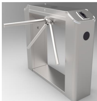
TS2122 Integrado con huella