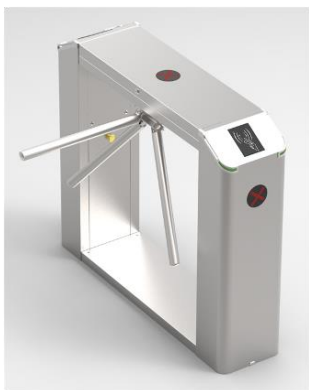
TS2111 Integrado con RFID

Además, puede registrar el control de presencia del personal por lo que es perfecto para gimnasios, fábricas, empresas, instituciones públicas, etc.