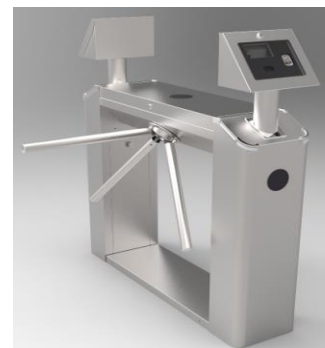
Bajo petición Integrado con facial